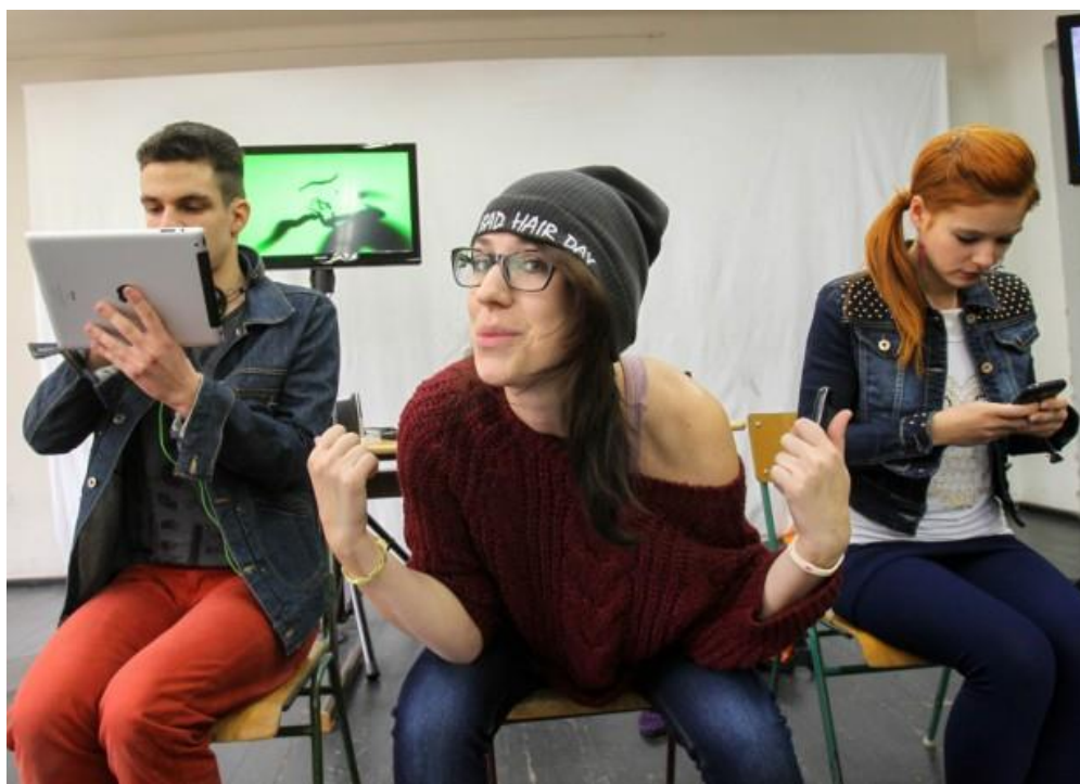
A Cyber Cyrano főszereplői

Egy jó iskolában, tehetséggondozó programban az oktatást mindig kiegészíti a hatékony nevelés, személyiségfejlesztés. A Zrínyi Miklós Gimnáziumban olyan speciális formákban is megvalósul ez, mint az Arany János Tehetséggondozó Program önismereti órái. Ebből a folyamatból a színház is kiveszi a részét, nem csak a Szépirodalmi Műhely, hanem a helyi Hevesi Sándor Színház „Tantermi Deszka” kezdeményezése is. Míg korábban a „Beavató színházban” egy-egy előadást segítettek értelmezni a rendezői, színházi elvek feltárásával a nagyszínpadon iskolásoknak, addig a Tantermi Deszka keretében az iskolák osztálytermében egy előadáshoz kötődően interaktív módon társadalmi és emberi kérdéseket beszélnek meg alkotók és diákok, olyanokat, amelyek érdeklik a tizenéves korosztályt.