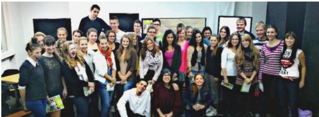
A Zrínyi 10.b osztálya a Cyber Cyrano premierének közönsége

Egy jó iskolában, tehetséggondozó programban az oktatást mindig kiegészíti a hatékony nevelés, személyiségfejlesztés. A Zrínyi Miklós Gimnáziumban olyan speciális formákban is megvalósul ez, mint az Arany János Tehetséggondozó Program önismereti órái. Ebből a folyamatból a színház is kiveszi a részét, nem csak a Szépirodalmi Műhely, hanem a helyi Hevesi Sándor Színház „Tantermi Deszka” kezdeményezése is. Míg korábban a „Beavató színházban” egy-egy előadást segítettek értelmezni a rendezői, színházi elvek feltárásával a nagyszínpadon iskolásoknak, addig a Tantermi Deszka keretében az iskolák osztálytermében egy előadáshoz kötődően interaktív módon társadalmi és emberi kérdéseket beszélnek meg alkotók és diákok, olyanokat, amelyek érdeklik a tizenéves korosztályt.